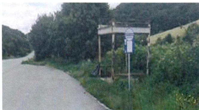
Obr. autobusová zastávka „Lipovník, Soroška“

V prípade interpelácie týkajúcej sa prístrešku autobusovej zastávky na Soroške Vás informujem, že Zastávka s názvom „Lipovník, Soroška“ sa nachádza v katastrálnom území obce Lipovník. Úrad Košického samosprávneho kraja komunikoval v tejto veci s obcou Lipovník, od ktorej sme dostali informáciu, že obec pripravuje komplexnú obnovu prístreškov autobusových zastávok v katastri obce Lipovník. Súčasťou obnovy je aj autobusová zastávka „Lipovník, Soroška“, ktorá dostane nový prístrešok.